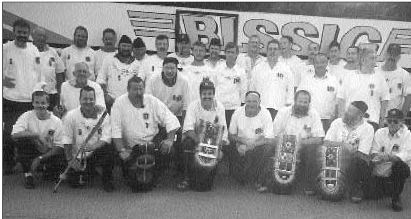
Die Greifler von Ingenbohl-Brunnen in Wattwil.

pd. Am Sonntag, 12. September, führt der Schwyzer Kantonale Vogelschutzverband seine Herbstwanderung im Gebiet Rigi Scheidegg-Rigi Klösterli durch. Treffpunkt und zugleich Ausgangspunkt dieser Wanderung ist die Bergstation Rigi Scheidegg um 09.00 Uhr. Unter der kundigen Führung von Franz Bucher aus Oberarth führt die gemütliche Wanderung über die schönen Rigialpen. Die geführte Exkursion dauert bis zirka 14.00 Uhr. Der Kantonale Vogelschutzverband mit dem hervorragenden Pflanzenkenner Franz Bucher freut sich, wenn möglichst viele Natur- und Vogel-freunde an dieser Herbstwanderung teilnehmen. Auskunft über die Durchführung erhält man zwei Stunden vor Beginn über Telefon 1600, Rubrik Club/Vereine.