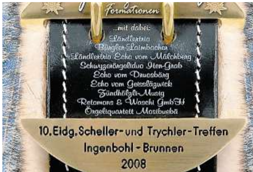
Neue CD mit beliebten Schwyzer Volksmusikanten: Acht Formationen aus dem Talkessel stimmen auf das «Eidgenössische» ein.

Bereits jetzt schlägt der Grossanlass in Brunnen hohe Wellen. Das «Eidge- nössische» soll auch musikalisch un-